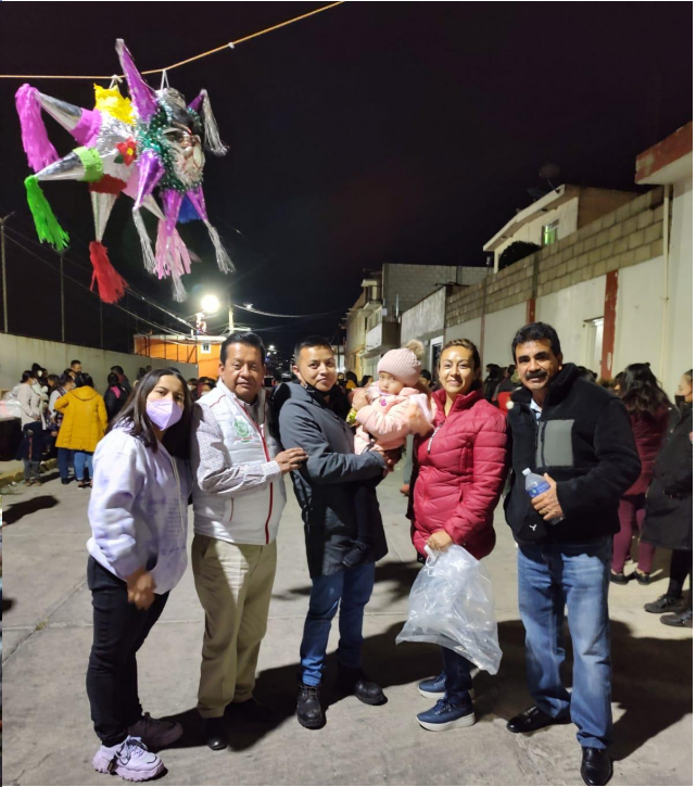
Participación en días culturales y festivos.